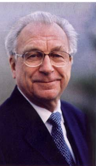
Lothar Späth

angeschlossenen Peripherie informieren können. Hauptbezugspunkt ist die Unternehmenssoftware Microsoft Dynamics NAV. Darüber hinaus werden Kooperationspartner wie OWL Maschinenbau neue technische Möglichkeiten vorstellen, z. B. das durchgängige Datenmanagement (PLM, PDM). Der VDMA wird die Bedeutung vergleichbarer Kennzahlen im Maschinen- und Anlagenbau präsentieren. Eine Podiumsdiskussion will zudem neue Impulse für den Mittelstand aufzeigen, indem renommierte Wirtschaftsexperten Potentiale und Wirtschaftlichkeitsanalysen miteinander bewerten. Im parallel laufenden Seminar berichten Referenten aus der Praxis, Themen sind u. a. „Manufacturing Execution (MES) als Rückgrat der Automation“ sowie „Kostensparnis und Leistungssteigerung durch ERP“. Kulinarischer Abschluss des Events wird ein Flying-Dinner mit Kreationen des Sterne-Kochs Elmar Simon sein. ■