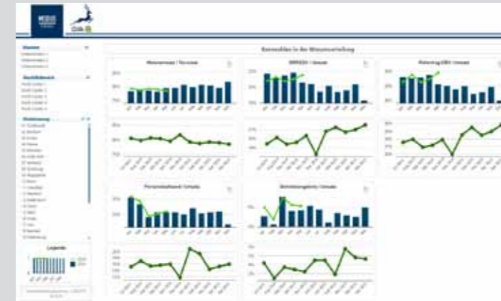
Abb. 1/Management Information mittels Dashboard